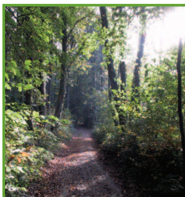
Le bois de Ricquebourg.

Au printemps, de remarquables parterres de jonquilles ( narcissus pseudonarcissus ), de jacinthes bleues ( hyacinthoides non scriptus ) et de muguet ( convallaria maialis ) tapissent les sous-bois.