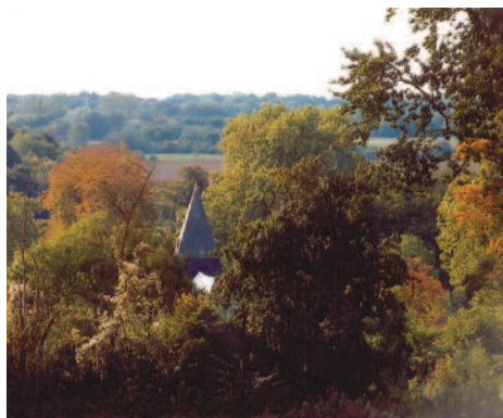
Vue du clocher de Ricquebourg.

fourche (10), emprunter la voie de gauche et continuer tout droit. Le long du chemin forestier, longer une cabane de chasse sur la droite avant d'atteindre un petit plateau, (11). Après 500 m sur le plateau bifurquer à droite (12) afin de suivre le sentier qui longe le « Bois de la Motte ». Après avoir abouti au chemin qui conduit au hameau de « la Motte », partir sur la gauche (13) et continuer tout droit (14) afin de rejoindre le « cimetière de Gury » achevant ainsi la promenade.