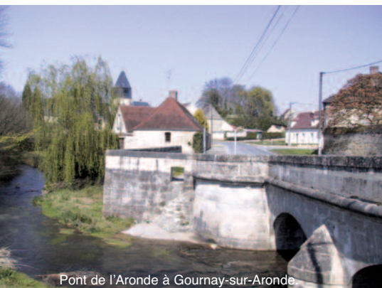
Pont de l'Aronde à Gournay-sur-Aronde

Dès la période celtique, la vallée de l'Aronde devint un site majeur. Il fut découvert dans l'enceinte de l'actuel parc du château de Gournay, un sanctuaire gaulois datant du III ème siècle av. J.-C. Les tribus bellovaques abandonnèrent plus de 2000 armes et 300 panoplies de guerriers sur ce site. (Collection exposée au musée Vivenel de Compiègne).