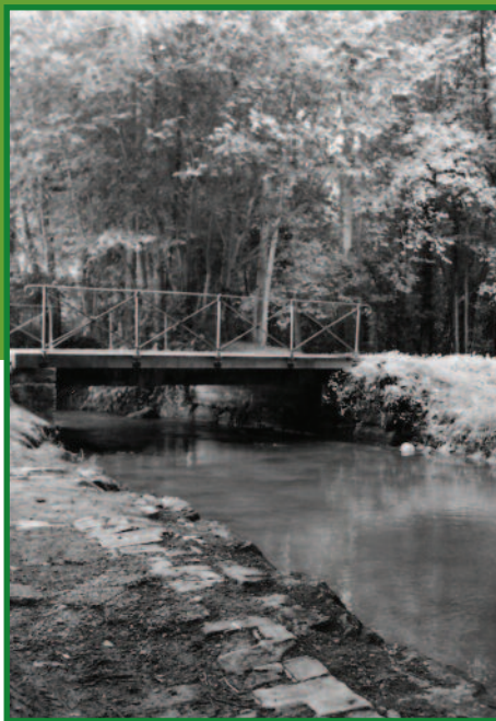
Le ruisseau de la Somme d'Or