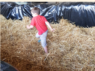
Piscine à paille