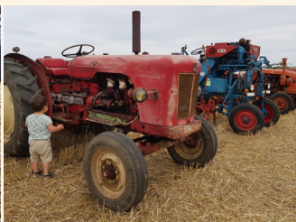
Expo agricole avec les Vieilles Mécaniques Picardes et voitures anciennes

À 12h30 et 13h30, concert de l'Accordéon Club Noyonnais.